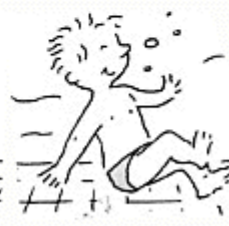
Je m'assois au fond de l'eau