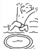
Avec élan dans un cerceau