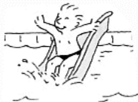
Les pieds en avant