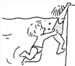
Je descends le long d'un camarade