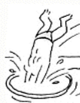
Je plonge dans un cerceau