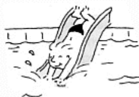
La tête en avant