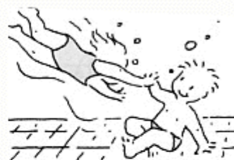
Je salue un camarade