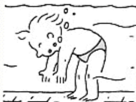
J'ouvre un peu les yeux