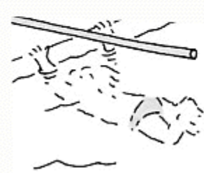
Je passe sous la perche