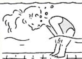
J'ouvre complètement les yeux