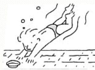
Je fais de la pêche sous-marine