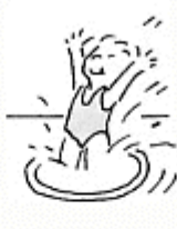
Dans un cerceau