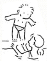
Avec de l'aide