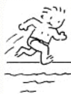
Avec de l'élan