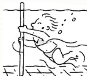
Je tourne autour de la perche